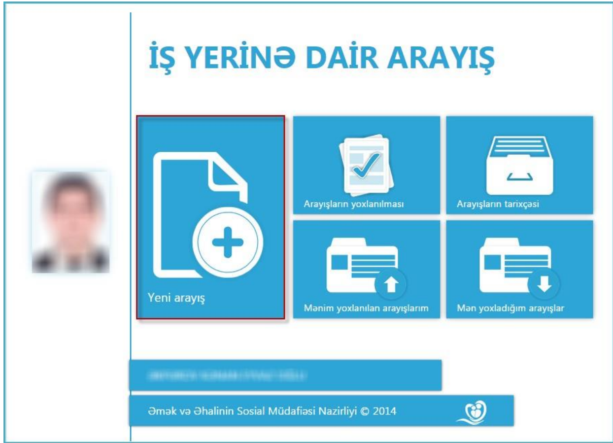
Şəkil 3. İş yerinə dair arayış

2.3. Əgər istifadəçinin bir neçə qüvvədə olan əmək müqaviləsi bildirişi olarsa, Axtarış düyməsi vasitəsilə axtarış parametrlərinin əks olunduğu pəncərəni açıb, istənilən sahə üzrə axtarış apara bilər. (Şəkil 4)