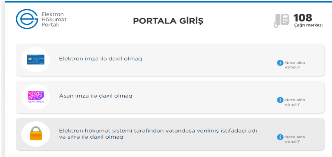
Şəkil 1. Sistemə giriş

1.1. " İş yerinə dair arayış " elektron xidmətindən istifadə etmək üçün https://www.e-gov.az/ internet ünvanına daxil olaraq " Portala giriş " düyməsini tıklamaq lazımdır. Daha sonra aşağıdakı şəkildə əks olunmuş autentifikasiya vasitələrindən istifadə etməklə sistemə daxil olmaq mümkündür.